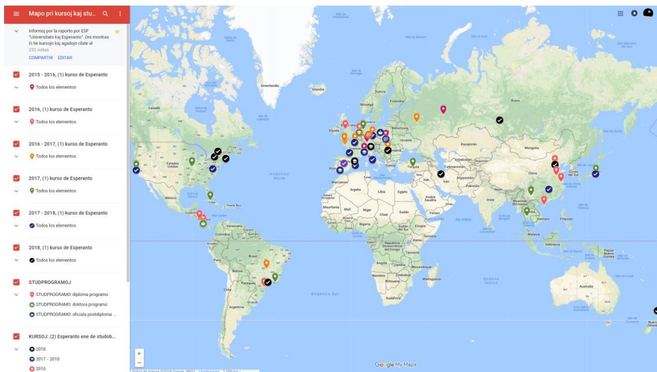
Figuro 1. Mapo pri kursoj kaj studprogramoj rilataj al Esperanto nur en supera edukado.